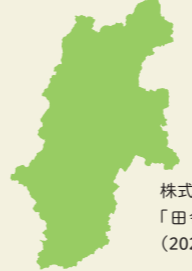
株式会社宝島社「田舎暮らしの本」(2026年2月号)