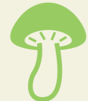
令和6年特用林産基礎資料(農林水産省)