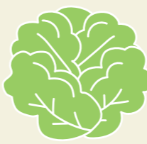
令和6年度作物統計調査(農林水産省)