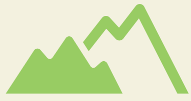
長野県観光部山岳高原観光課調べ