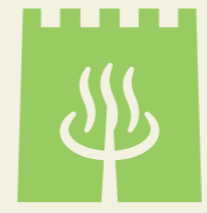
令和6年度温泉利用状況(環境省)