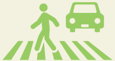
2025年「信号機のない横断歩道での歩行者横断時における車の一時停止状況全国調査」(JAF)