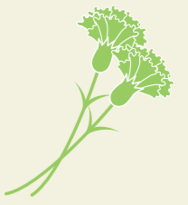
令和6年度作物統計調査(農林水産省)