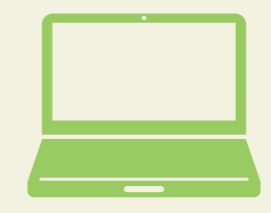
経済構造実態調査2024年確報品目別統計表(総務省・経済産業省)